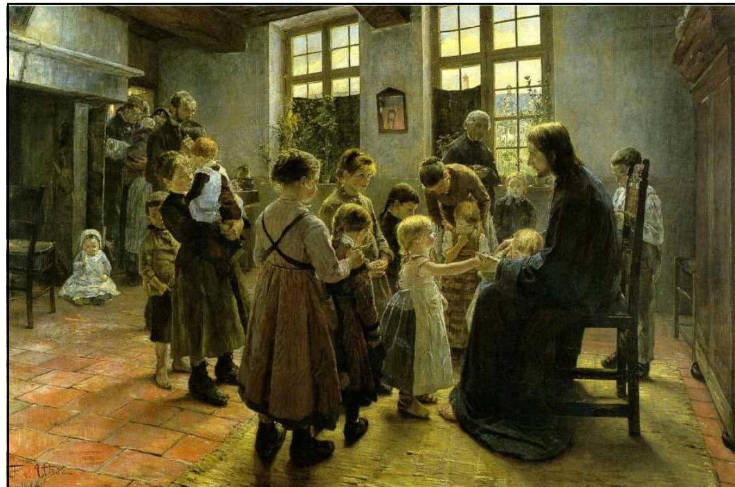
フリッツ・フォン・ウーデ「子どもたちを我に来させよ」(1884)

イエスさまの十字架は、わたしの恥のための十字架であったということ覚え、私たちのために涙を流し、血を流してくださいましたイエスさまのことを、日々覚えていきたいものです。