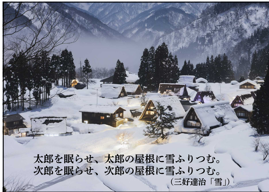
太郎を眠らせ、太郎の屋根に雪ふりつむ。 次郎を眠らせ、次郎の屋根に雪ふりつむ。 (三好達治「雪」)