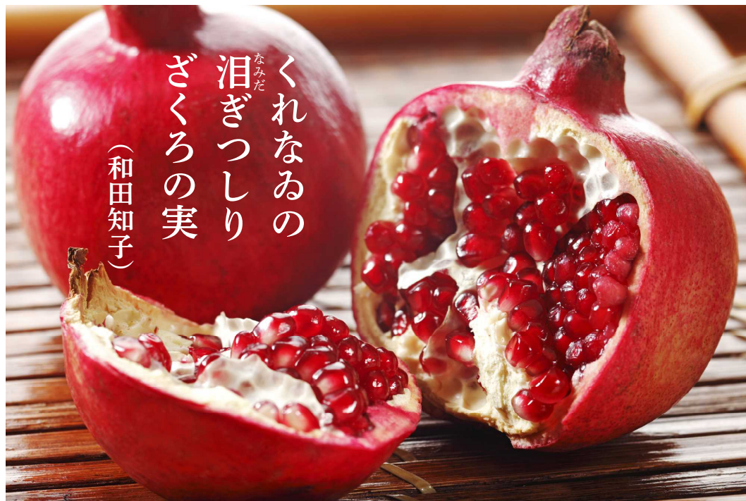
ザクロ(石榴、柘榴)は秋の季語。熟すると厚く硬い果皮が裂け、鮮紅色の多数の種子が現れる。食用にされる透明な外種皮は甘酸っぱい。