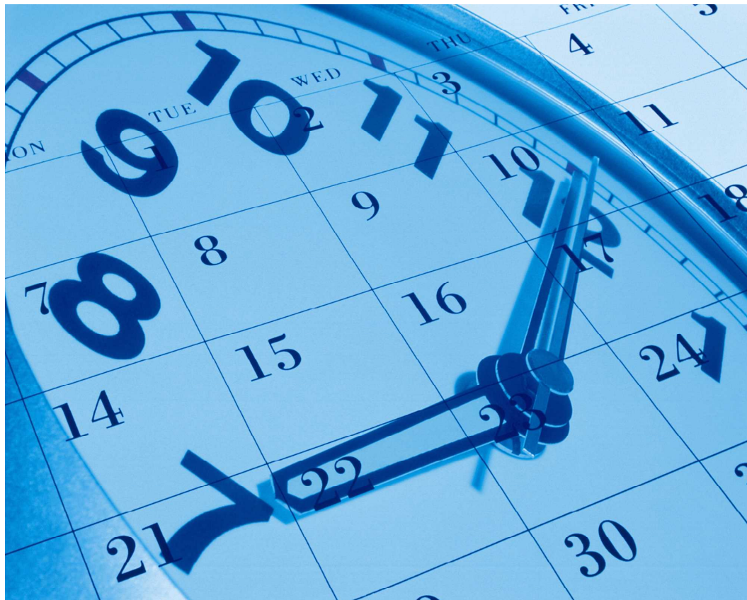
12月3日は「カレンダーの日」。明治5年12月3日、日本はそれまで採用していた旧暦(月の満ち欠けを使用した太陰暦)から新暦(太陽暦)に一齐に切り替え、その日は明治6(1873)年1月1日(元旦)となった。

学校の先生はもちろんのことですが、そんな謙遜を私たち誰もが持つべきではないでしょうか。