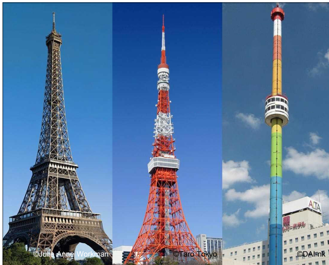
エッフェル塔(パリ、フランス) 1889年竣工、全高324m

人間は皆、罪人である点で区別はありません。また、皆ひとり残らず、神に愛されている点でも全く区別はありません。必要なのは、真実な悔い改めと罪の赦しのための十字架の愛を信じる信仰だけです。表面的などんなレットテルとも関係なく受け入れ、愛し、かけがえのない者として評価して下さるのが、聖書の教える神なのだと、いうことを知ってください。