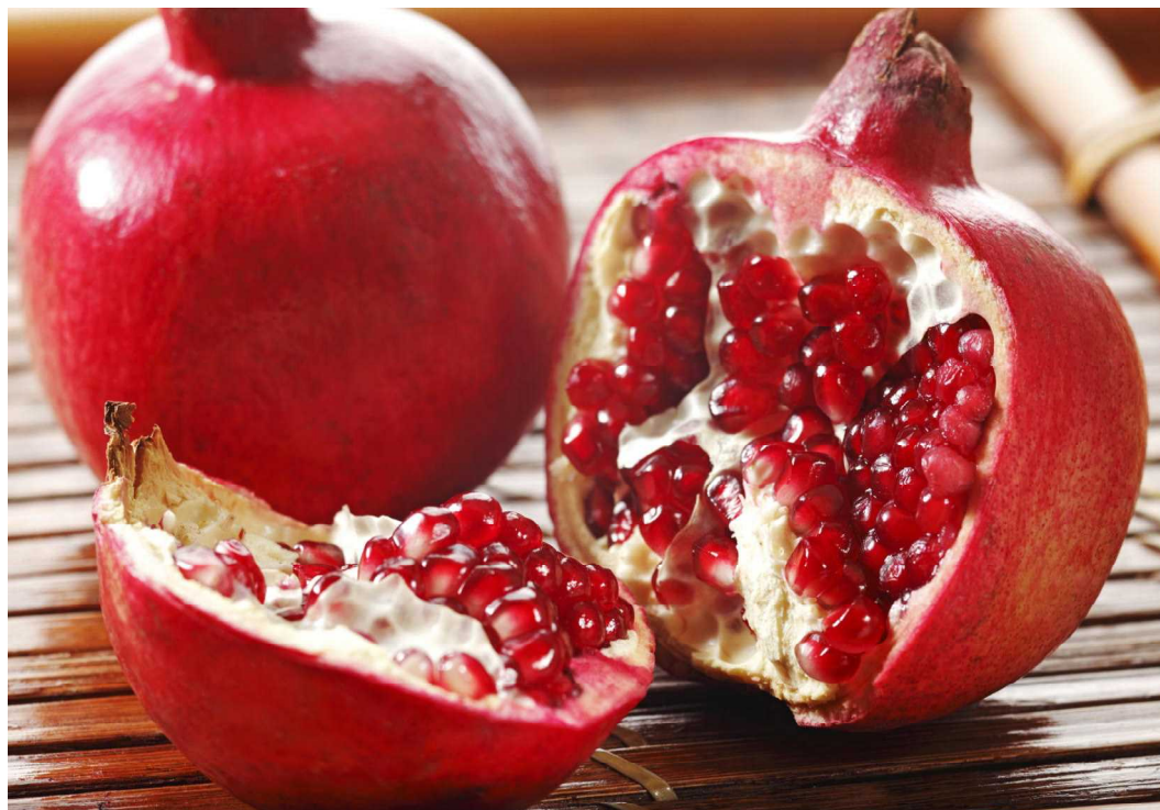
くれなゐの泪ぎつしりぎくろの実 (和田知子)

よい訓練に心を留め、創造主なる神を知り、敬い、豊かな知恵を体得していきたいものです。