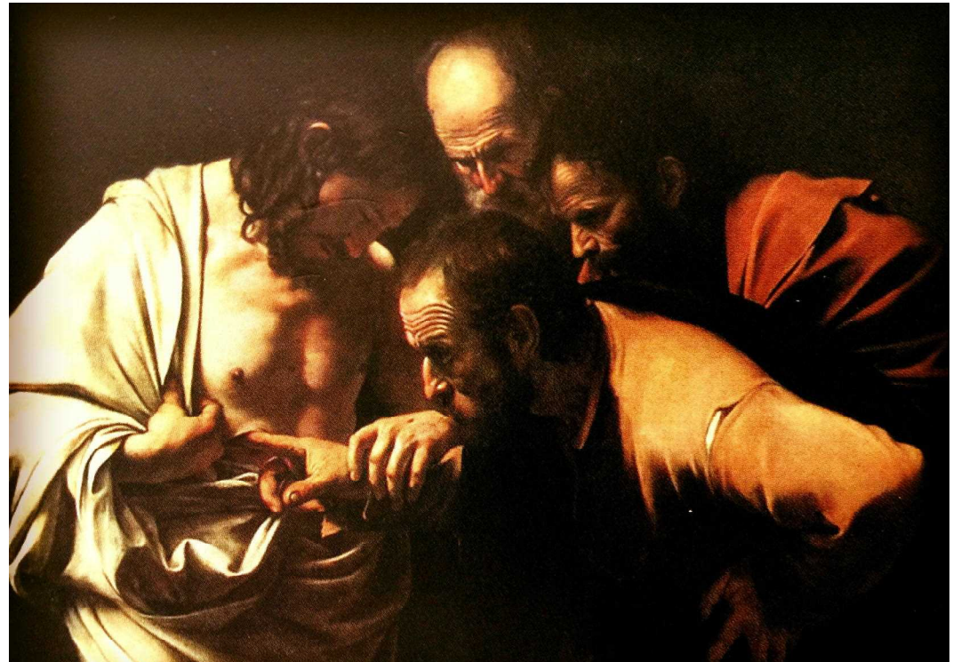
カラヴァッジョ「聖トマスの懐疑」(1600年前後) サンスーシ宮・国立美術館(ドイツ・ポツダム)所蔵 「光と影の魔術師」と呼ばれたカラヴァッジョの傑作。トマスがイエスのわき腹の傷に実際に指を差し込んでいる記述は聖書にはなく、カラヴァッジョの創作である。トマスは後に南インドまで宣教したという伝承も残り、インド出身で禅宗の開祖、達磨大師(だるまのモデル)は、トマスが伝説化したものという珍説も存在する。

24 十二弟子のひとりで、デドモと呼ばれるトマスは、イエスが来られたときに、彼らとつしよにいなかった。25 それで、ほかの弟子たちが彼に「私たちは主を見た」と言った。しかし、トマスは彼らに「私は、その手に釘の跡を見、私の指を釘のところに差し入れ、また私の手をそのわきに差し入れてみなければ、決して信じません」と言った。26 八日後に、弟子たちはまた室内におり、トマスも彼らとつしよにいた。戸が閉じられていたが、イエスが来て、彼らの中に立って「平安があなたがたにあるように」といわれた。27 それからトマスにいわれた。「あなたの指をここに付けて、わたしの手を見なさい。手を伸ばして、わたしのわきに差し入れなさい。信じない者にならないで、信じる者になりなさい。」28 トマスは答えてイエスに言った。「私の主。私の神。」29 イエスは彼に言われた。「あなたはわたしを見たから信じたのですか。見ずに信じる者は幸いです。」