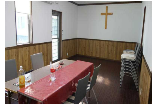
8坪の旧会堂は、交わりのために活用される。