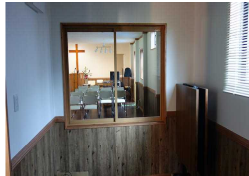
礼拝が一望できる多目的室(母子室)も設置。