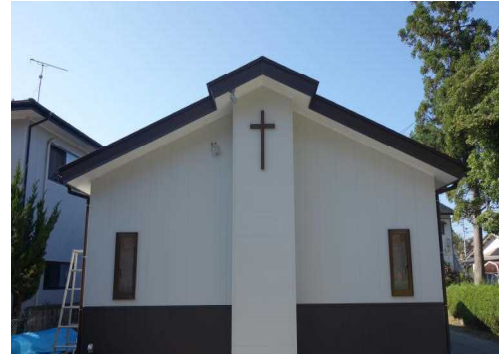
旧会堂に併設された、村上教会の新礼拝堂。