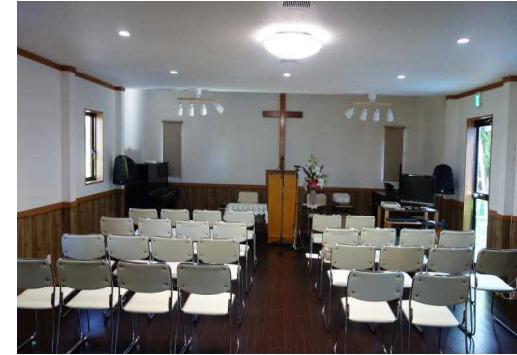
面積は17.5坪に倍増し、30人以上収容可能。