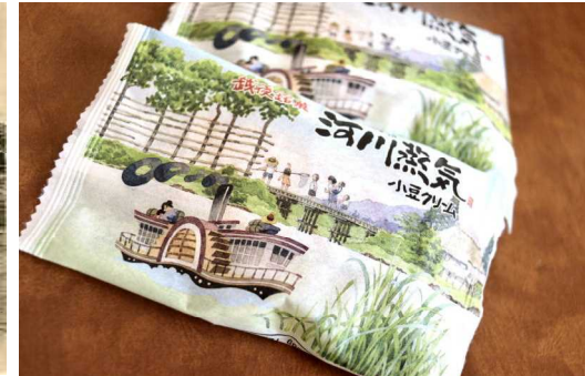
葛塚の発展に伴い、新井郷川に蒸気船が運航した。現在の下他門交差点付近に発着場があった。左:昭和初期まで続いた蒸気船 右:地元銘菓『河川蒸気』のパッケージ