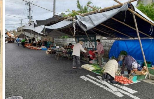
葛塚市(いち)は、260年の歴史を持つ。150年前に現・常盤町が開町、葛塚市の中心地となった。左:約120年前の葛塚常盤通の写真 右:現在の常盤町での葛塚朝市