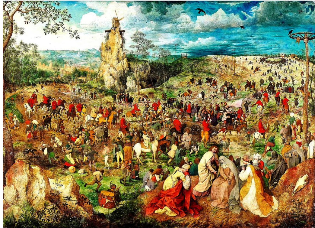
ピーテル・ブリューゲル作『ゴルゴタの丘への行進』(1564年、ウイーン美術史美術館蔵)。中央に十字架を背負うイエスが配置されているが、よく見なければわからないほど小さく描かれており、また人々の視線はイエスそのものを見ていない(見ているようでどこかずれている)。周りの人々の服装は16世紀のものだが、画面手前のマリアやヨハネは区別されて描かれている。なお画面の中に一人だけイエスを直視している人がいるが、これがブリューゲルのサインである。後で虫眼鏡で探してほしい。