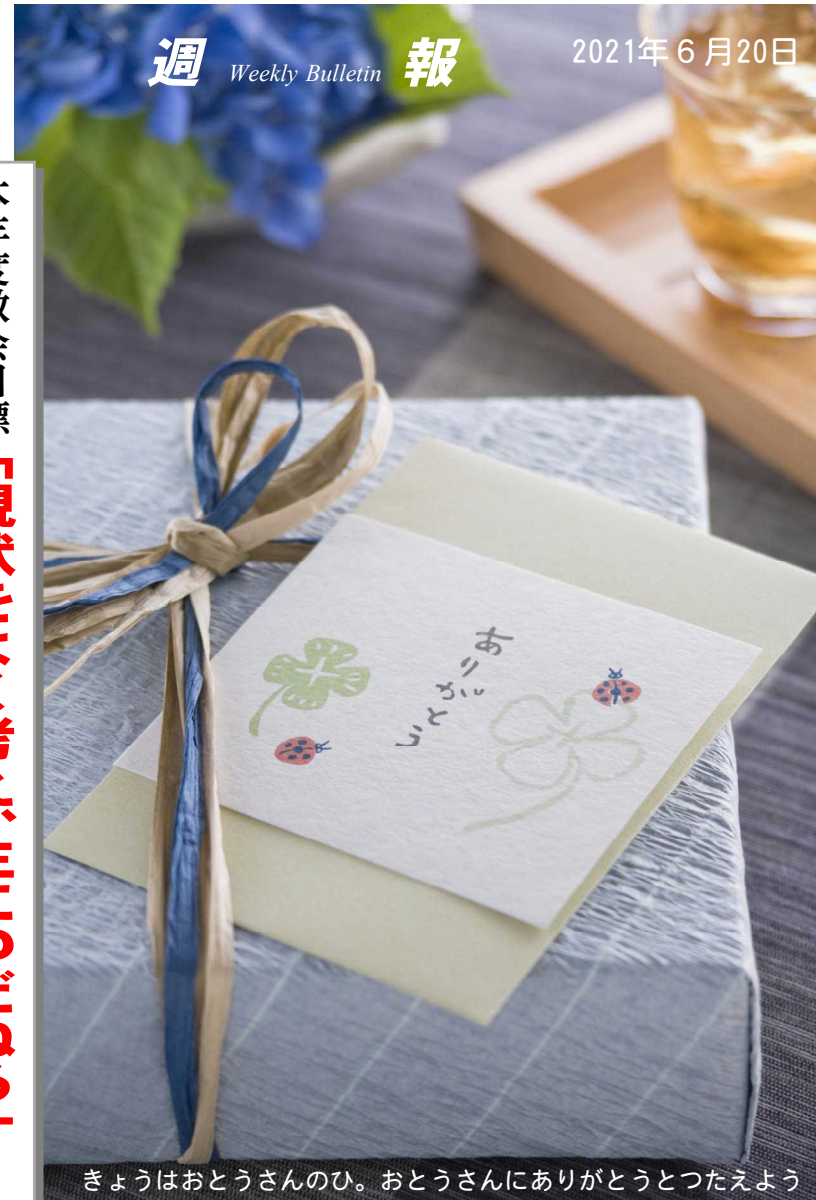
きょうはおとうさんのひ。おとうさんにありがとうとつたえよう