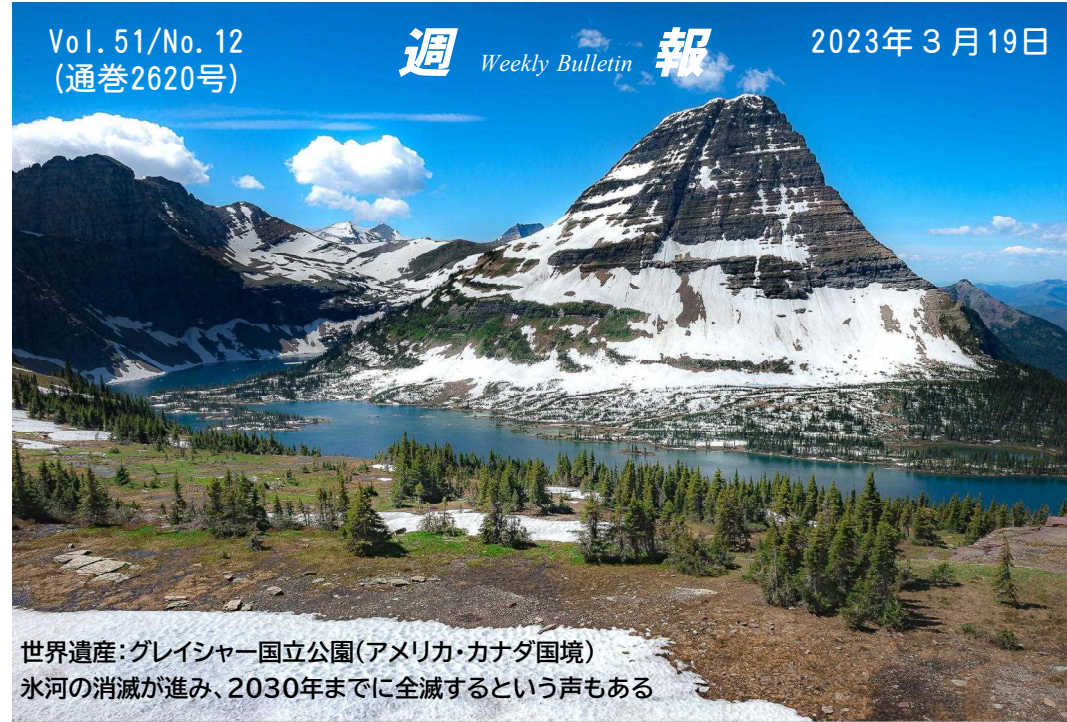
世界遺産：グレイシャー国立公園(アメリカ・カナダ国境) 氷河の消滅が進み、2030年までに全滅するという声もある

7 こ う し て 、 か み の こ と ば は ま す ま す ひろ ま っ て い き 、 エル サ レ ム で 弟 子 の かず が ひ じょう ぶ に ふ ぜ り に あ い っ た 。 ま た 、 さい し が お お ぜ い の つ ぎ つ ぎ しん こう に はい い っ た 。